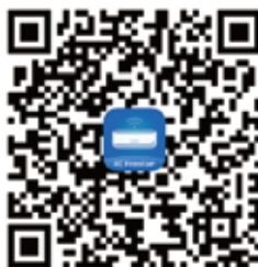
iOS QR κωδικός Η AC Freedom στο apple store