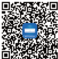
Android QR κωδικός Η AC Freedom στο Google Play

Σκανάρετε τον παρακάτω κωδικό QR με τη smartphone συσκευή σας και κατεβάστε την AC Freedom εφαρμογή.